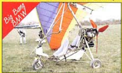
65 cv de silence, 4 temps d'économie