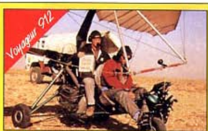
L'exigence et la fiabilité aéronautique

JMD : J'aimerais m'adresser à toutes les personnes qui désirent faire de l'ULM leur profession et leur dire que ce ne sera plus un loisir mais un vrai métier qui ap-